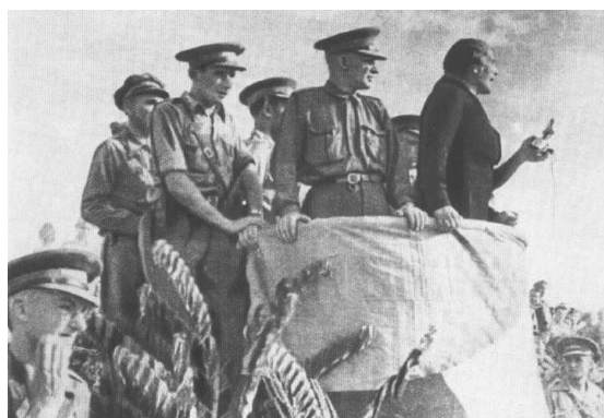
"La pasionaria" dum la milito. La homo kiu aperas malsupre maldekstre estas la germana esperantista verkisto, gvidanto de la Internaciaj Brigadoj, Ludwig Renn.

Kaj al la komunistoj apartenis la vaska politikisto el tiu periodo plej konata ekster Hispanio: Dolores Ibárruri, La Pasionaria (La Pasionulino). Filo kaj edzo de ministoj, ŝi suferis la terurajn kondiĉojn kiujn ni antaŭe priskribis, kun ĉiamaj malsanoj kaj malsato (pluraj ŝiaj infanoj mortis kiam beboj). Tre inteligenta, eĉ se ne klera, kun enorma oratorkapablo, forta kaj kuraĝa, ŝi fariĝis kvazaŭ la simbolo de la laborista virino, kaj poste, dum la milito, de la volo de rezistado. Ŝi famigis tiujn famajn sloganojn (ne originale siajn, cetere): "Ili ne trapasos!" kaj "Pli valoras morti piede ol vivi surgenue". Poste ŝi fariĝos prezidanto de la hispana komunista partio kaj gvidanto de la Komunista Internacio.